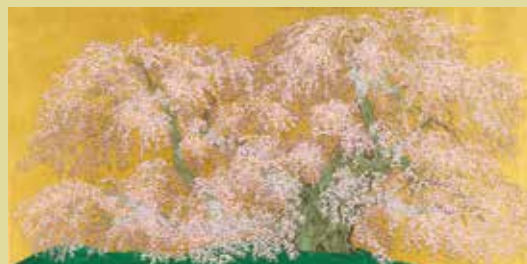
中島千波「晴耀三春乃瀧櫻」