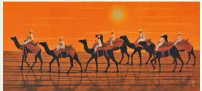
シルクロードをゆくキャラバン東・太陽