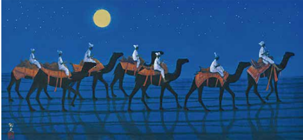
シルクロードをゆくキャラバン西・月

ご希望の作品はご予約を承り、販売収益の一部は、公益社団法人日本ユネスコ協会連盟の行う「東日本大震災子ども支援募金」に寄付させていただきます。